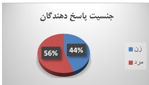
نمودار شماری ۲: توزیع جنسیت پاسخ دهندگان

سطح تحصیلات پاسخ دهندگان همان‌طور که جدول شماره ۴ نشان می‌دهد، مدرک تحصیلی ۱۳ درصد پاسخ دهندگان، زیر لیسانس، ۶۳ درصد فوق لیسانس و ۲۳ درصد دکتری و بالاتر است.